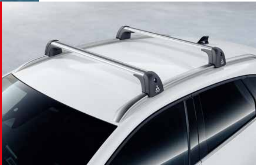
◀ Μπάρες οροφής Τύπου Wingbar.