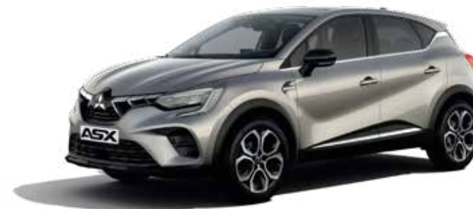
▲ Steel Grey