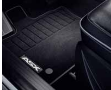
▲ Υφασμάτινα πατάκια Comfort και Elegance.