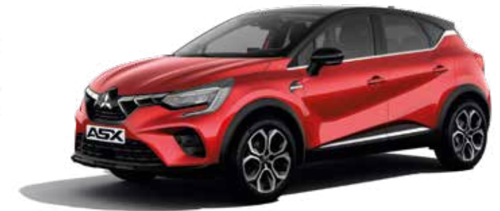
Sunrise Red ▲