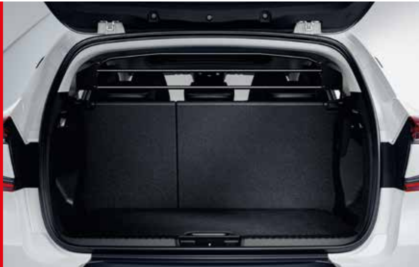
◀ Διαχωριστικό Με μαύρη επένδυση.