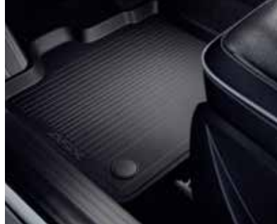
▲ Λαστιχένια πατάκια