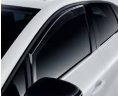
▲ Πλευρικοί εκτροπείς αέρα Μόνο για τα μπροστινά παράθυρα.