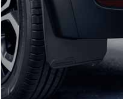
▲ Λασπωτήρες Για τους εμπρός και πίσω τροχούς.