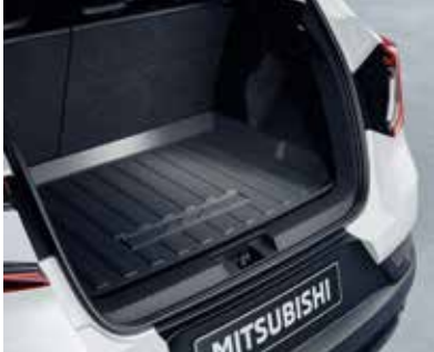
▲ Προστατευτικό χώρου αποσκευών