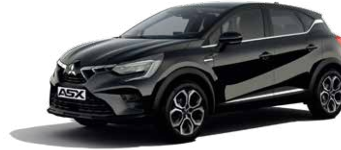
▲ Onyx Black