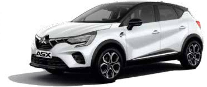
Crystal White ▲