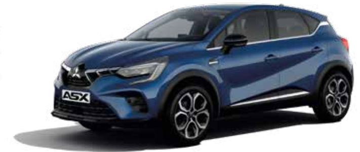
Royal Blue ▲