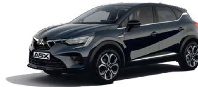
▲ Charcoal Blue

Το ASX είναι διαθέσιμο σε μια εκπληκτική σειρά χρωμάτων. Για να δώσετε το στίγμα σας στο όχημα, επιλέξτε το χρώμα Crystal White με οροφή σε Onyx Black. Μπορείτε επίσης, να επιλέξετε τη διχρωμία ή το χρώμα Sunrise Red.