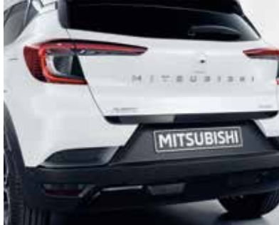
▲ Διακοσμητικό πόρτας χώρου αποσκευών Piano Black ή Brushed Silver.